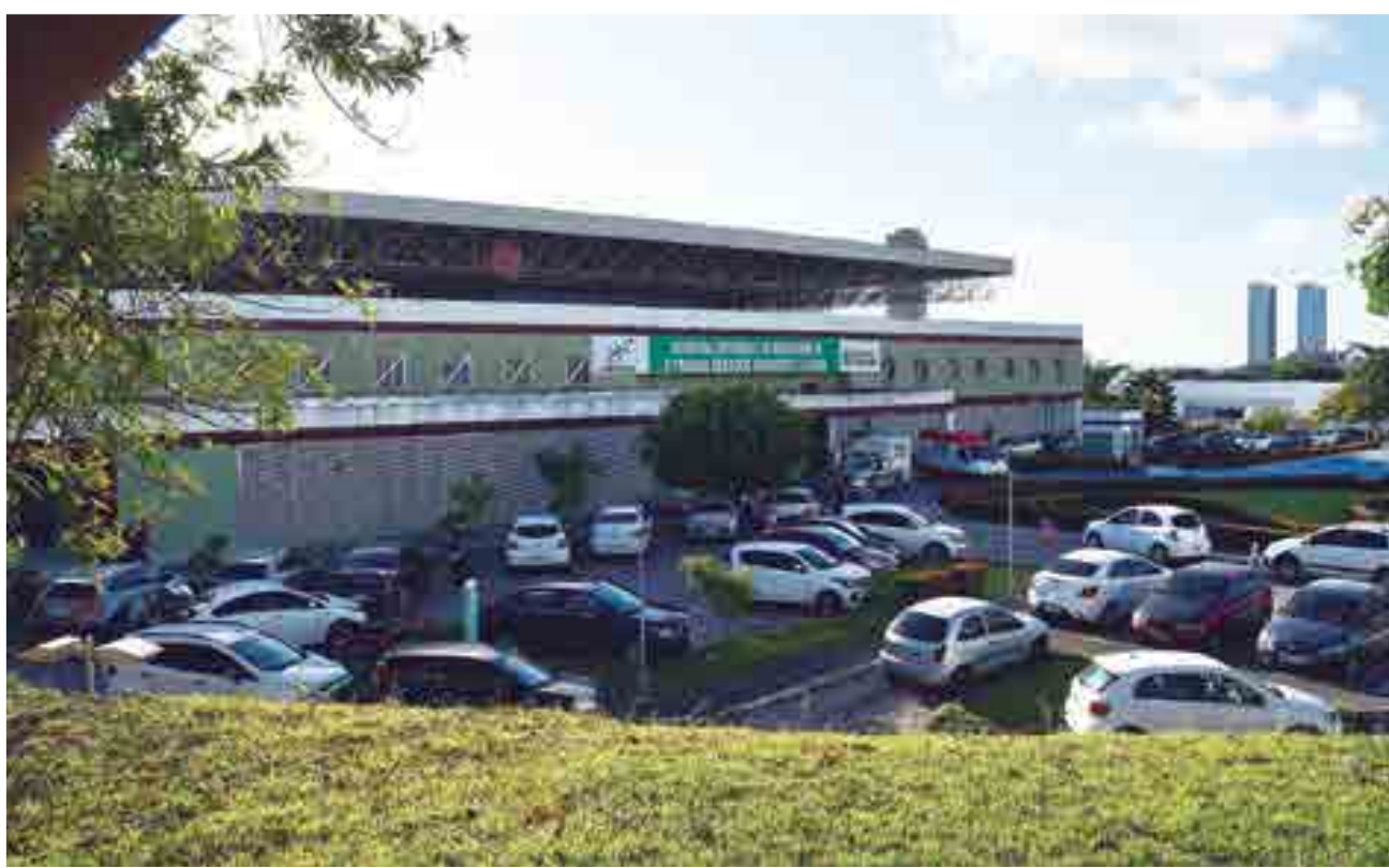
O Hospital Estadual de Emergência e Trauma Senador Humberto Lucena, em João Pessoa, foi fundado no dia 4 de agosto de 2001

O ex-governador Pedro Gondim foi um dos fundadores do Partido Social Democrático (PSD), e assumiu o Governo do Estado na vaga deixada pelo governador Flávio Ribeiro Coutinho, que afastou-se do cargo