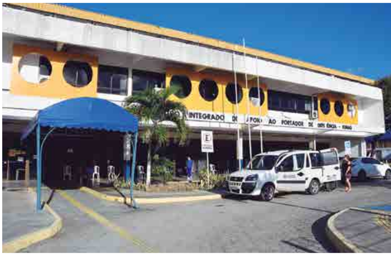
A Funad, fundada no ano de 1989, no Pedro Gondim, foi criada para oferecer atendimento a pessoas com os mais diversos tipos de deficiência

///Enquanto governador, Pedro Gondim era frequentador do Ponto de Cem Réis e dos cinemas existentes no Centro da cidade. Daí sua popularidade na época///