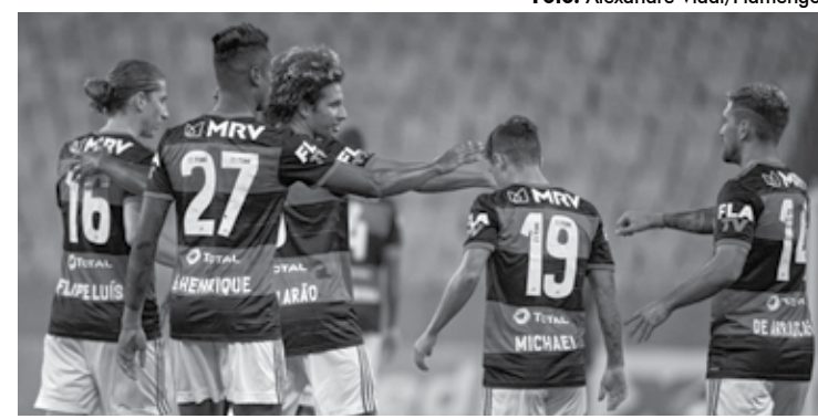
Flamengo está dando sinais de reação após a excelente vitória sobre o Bahia