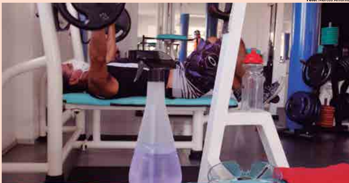
Segundo o plano de flexibilização da Prefeitura de João Pessoa, as academias podem voltar com atividades coletivas, com 50% de alunos por turno

Piscinas em clubes e condomínios, test-drive em concessionárias e locadoras de veículos também estão liberados