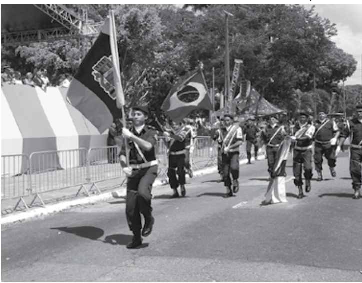
Tradicional parada cívica militar na Av. Getúlio Vargas, no Centro de João Pessoa

Nos meus tempos de menino de Jaguaribe, o 7 de Setembro tinha dois eventos muito especiais. O primeiro, mais importante, era a parada cívica militar e estudantil que arrebanhava para as calçadas da Avenida Getúlio Vargas (da Lagoa até o Liceu) uma multidão, sequiosa para assistir ao desfile. O outro, não menos importante, era o torneio de futebol que Frei Albino realizava todos os anos, no campinho da Cruzada.