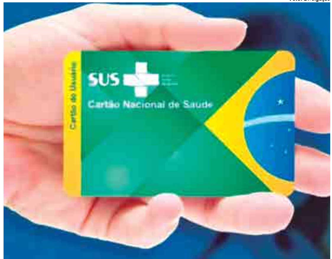
A pesquisa aponta que a internação através do SUS diminuiu conforme o aumento no rendimento domiciliar

O nível de instrução tinha grande influência sobre esse indicador. Enquanto 47,6% das pessoas com nível superior completo tinham plano de saúde médico, apenas 15,7% das com o ensino médio concluído e o superior incompleto estavam nessa mesma condição. As proporções são ainda mais baixas entre aqueles com fundamental completo e médio incompleto (7,4%) e sem instrução e fundamental incompleto (5,4%).